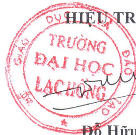
Đỗ Hữu Tài